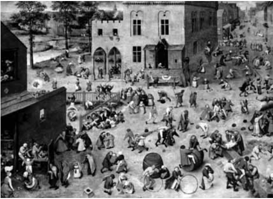
Kinderspelen (1560) door Pieter Bruegel de Oude (ca.1525-1569)

te verschuilen in onschuldige, kinderlijke fantasieën. De aard van de ontwikkeling van de toonsoort F naar B, die de onderliggende basis vormt, is ontleend aan een passage in de doorwerking van het eerste deel van Mahlers Derde Symfonie , en in de opening van Schönbergs Tweede Strijkkwartet . Anders dan in die beide voorbeelden, treedt hier aan het eind van het kwartet een echte – zij het tijdelijke – oplossing op. Zoals wanneer het gordijn valt voor de herenigde Graaf en Gravin in Figaro , zo vraagt men zich hier af hoe lang het F/B-bestand stand zal houden, en de ‘spelen’ weer zullen los breken. (naar een toelichting van Peter Maxwell Davies)