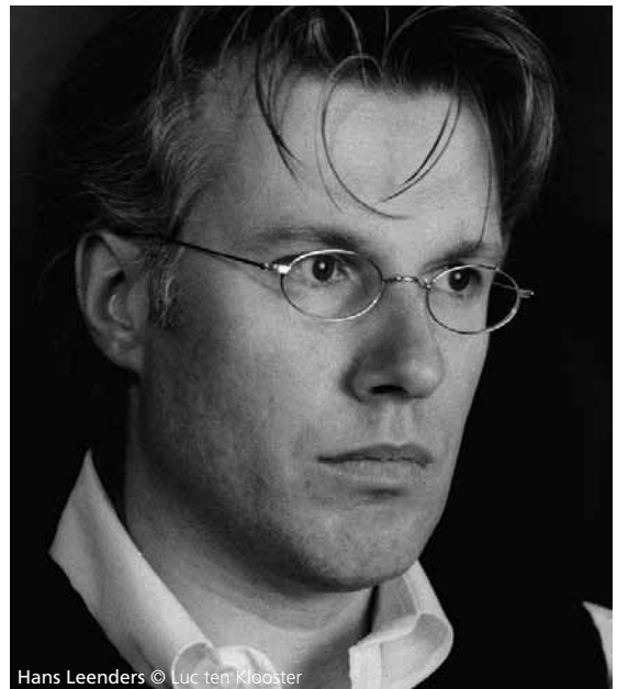
Hans Leenders

Dit korte, polyfone gedeelte wordt gekenmerkt door een ritmische melodie, die de gestrengheid van het gesproken woord wil aangeven: ik geef jullie een nieuw gebod, of beter nog, dit is mijn nieuw gebod.