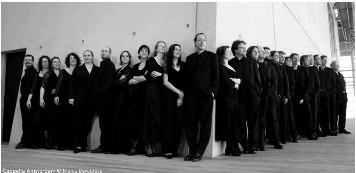
Cappella Amsterdam

Cappella Amsterdam, geroemd om de verfijnde ensembleklank en grote veelzijdigheid, voelt zich thuis in de werken van eigentijdse én in die van oude meesters. Een bijzondere affiniteit heeft het koor met het oeuvre van Nederlandse componisten. Cappella Amsterdam werkt geregeld samen met andere gerenommeerde koren, ensembles, dirigenten en orkesten in bijzondere en uiteenlopende producties. Bij Harmonia Mundi verscheen inmiddels een aantal cd's. De cd Lux Aeterna , met werken van György Ligeti en Robert Heppener, is bekroond met de 'Diapason d'Or de l'année 2009'. Ook de recent verschenen cd's met werken van Sweelinck en met Golgotha van Frank Martin zijn zeer goed ontvangen. In november 2009 ontving Cappella Amsterdam de VSCD Klassieke Muziekprijs in de categorie 'meest indrukwekkende prestatie van een klein (kamermuziek) ensemble'. In 2010 is het koor onder meer genomineerd voor de Amsterdamprijs voor de Kunst.