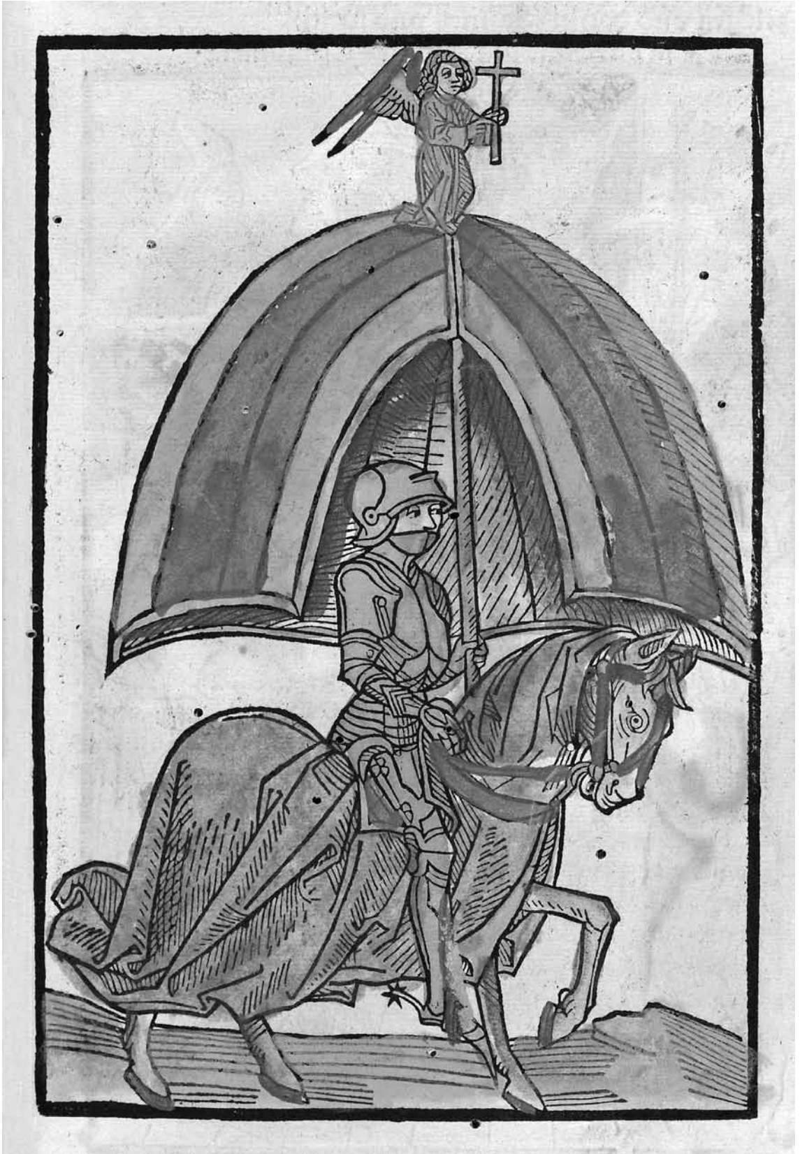
Ridder in gotische wapenrusting © houtsnede uit Concilium zu Constanz (1483)