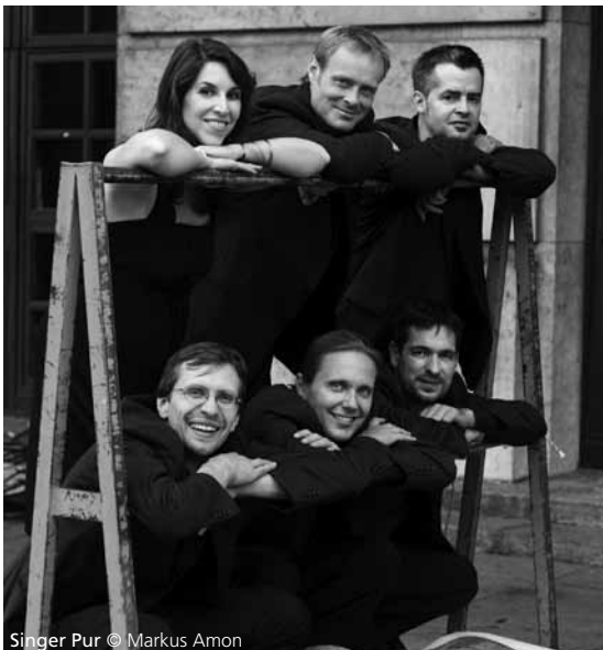
Singer Pur

Behalve in Italië heeft Cantica Symphonia concerten gegeven in onder meer Frankrijk, België, Zwitserland, Estland, Slovenië en Nederland. Het ensemble was te gast op festivals als Rencontres de Musique Médiévale du Thoronet, het Festival van Vlaanderen, Tage alter Musik in Regensburg, Concerts de St. Germain in Genève, Settembre Musica en Unione Musicale in Turijn en Festival Oude Muziek Utrecht.