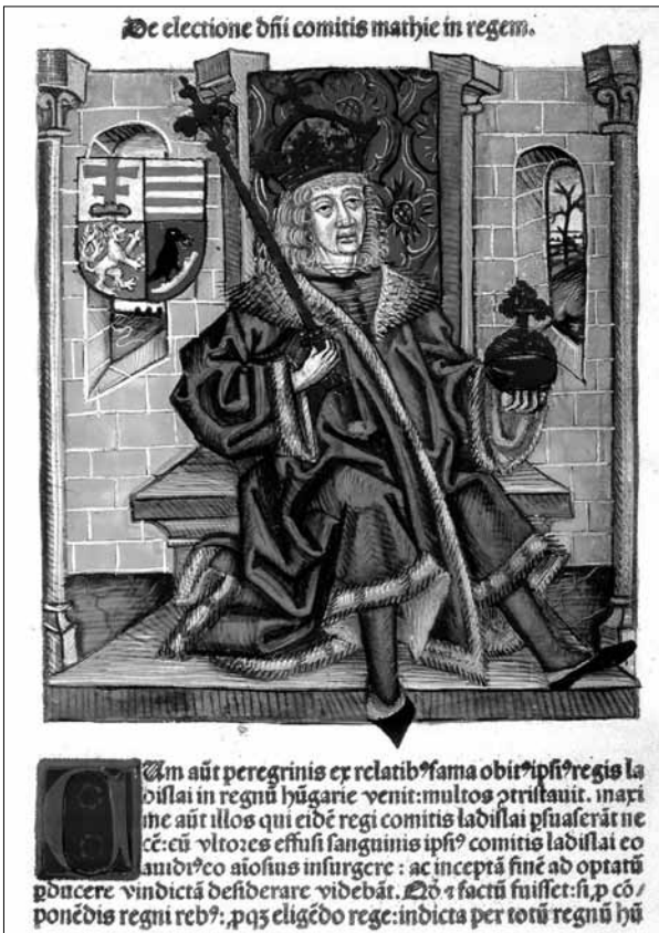
Matthias Hunyadi I (Corvinus) van Hongarije

Kan het zijn dat het hier gaat om een huwelijksge- schenk van Karel de Stoute aan Beatrice, die net koningin van Hongarije is geworden?