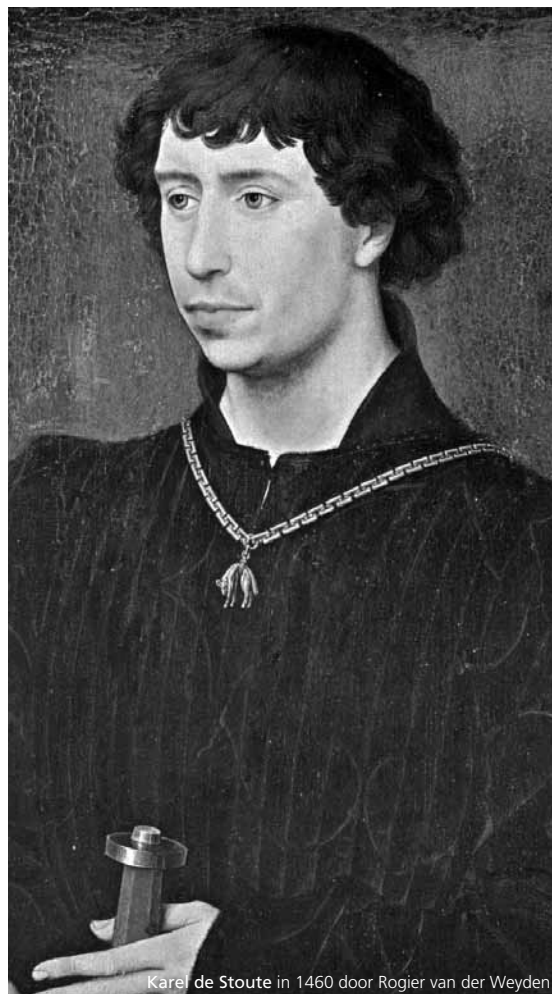
Karel de Stoute in 1460 door Rogier van der Weyden

Is het vreemd dat de melodie zo sterk in zwang raakte, juist rond de tijd dat de Ottomaanse Turken Constantinopel bezetten in 1453? Deze gebeurtenis had een geweldig psychologisch effect op de heersers en burgers in West-Europa. Voor Guillaume Dufay was het de aanleiding tot het schrijven van een lamento over het historisch onheil. En paus Pius II riep zelfs op tot een nieuwe kruistocht, waarvan ook de strijdlustige Karel de Stoute een warm voorstander was. De kruistocht kwam niet van de grond, de paus overleed aan koorts tijdens de voorbereidingen