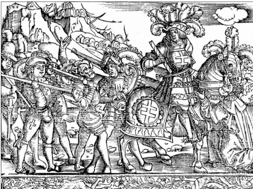
Karel de Stoute in de Slag bij Nancy in 1477

man in de titel. Al met al werden er in de vijftiende en zestiende eeuw maar liefst zo'n veertig missen over de l'Homme armé -melodie gecomponeerd, meer dan over enige andere melodie. Opvallend aan de al bekende mis over l'Homme armé van Antoine Busnois is dat de passage op de tekst 'Et incarnatus est', die precies het midden van de mis vormt, eenendertig