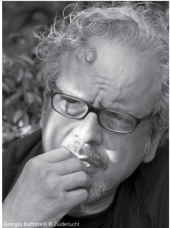
Giorgio Battistelli

Van 1993 tot 1996 was Battistelli artistiek directeur van Cantiere Internazionale d'Arte in Montepulciano. Hij werkte aan het Luciano Berio Centro Tempo Reale in Florence en aan het Centro di Sonologia Computazionale van de Universiteit van Padua. In 2003 werd Battistelli onderscheiden als 'Chevalier dans l'Ordre des arts et des lettres'. Gedurende het seizoen 2005/2006 was hij composer-in-residence bij De Vlaamse Opera en in 2007/2008 bij de Deutsche Oper am Rhein in Düsseldorf. Battistelli was artistiek directeur van La Biennale di Venezia (2004-2007) en artistiek directeur van de Fondazione Arena di Verona (2006/2007). Sinds maart van dit jaar heeft hij de artistieke leiding over het Orchestra della Toscana in Florence. Momenteel werkt hij aan een opera in opdracht van het Teatro La Scala voor uitvoering in het najaar van 2013. In de periode 2012-2015 zal hij composer-in-residence zijn bij het Teatro San Carlo in Napels.