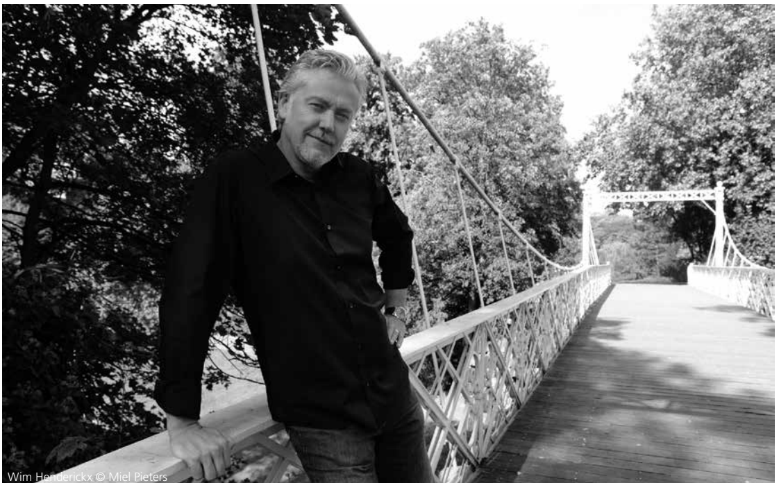
Wim Henderickx