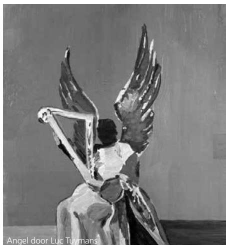
Angel door Luc Tuymans

Toen Luc Tuymans in 2012 het beton van het Concertgebouw Brugge verfraaide met de muurschildering Angel was dat het begin van een meerjarig project om componisten in dialoog te laten treden met dit sterke beeld. Baltakas liet zich niet alleen inspireren door de