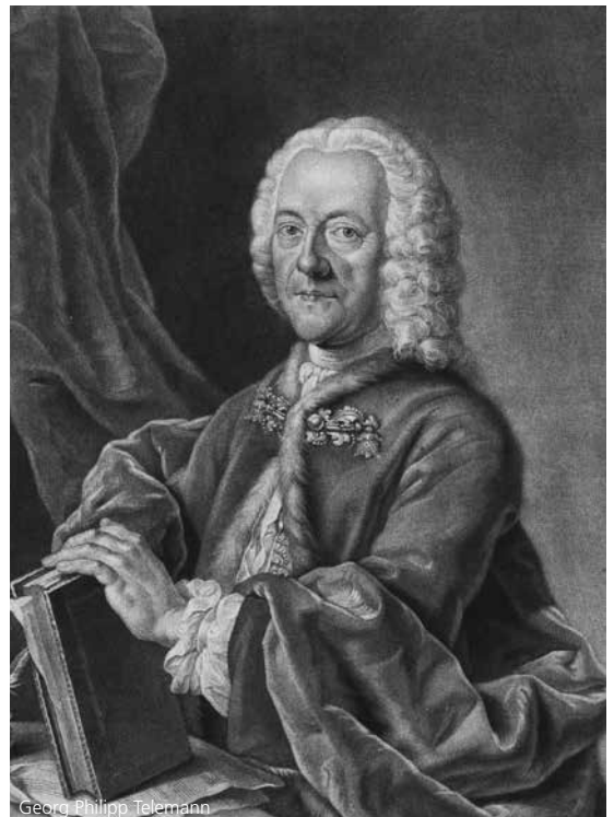
Georg Philipp Telemann