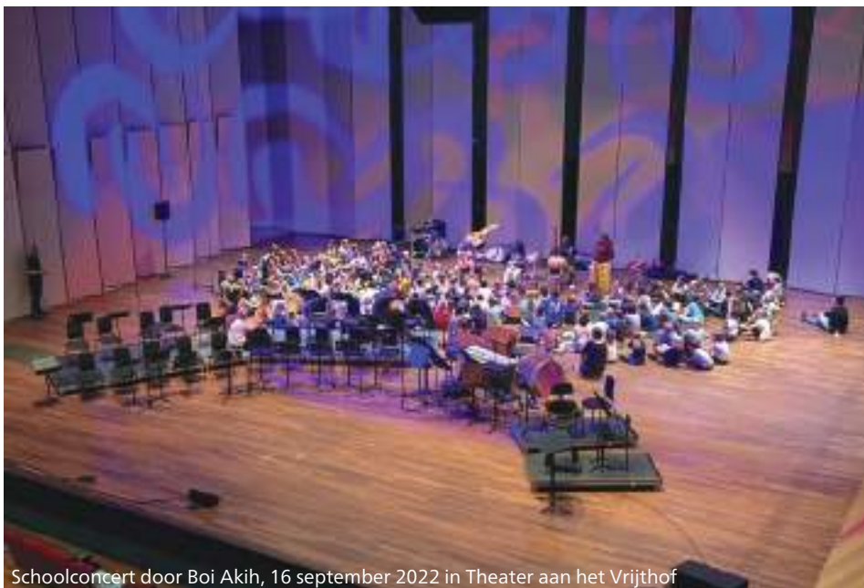
Schoolconcert door Boi Akih, 16 september 2022 in Theater aan het Vrijthof

De honorering van de leden van de programmacommissie is verschillend. Een lid heeft een vaste aanstelling in dienstverband en een ander werkt als ZZP'er. De voorzitter verricht zijn werk onbezoldigd. De overige leden krijgen een vacatiegeld dat binnen de ANBI-normen valt. Aan het einde van de komende beleidsperiode 2021-2024 hopen we de honorering van de leden van de programmacommissie te hebben geharmoniseerd.