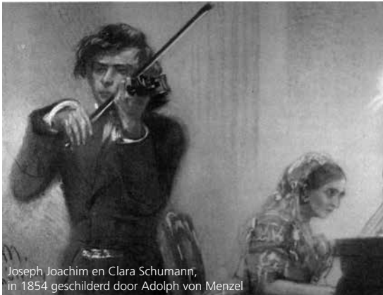
Joseph Joachim en Clara Schumann, in 1854 geschilderd door Adolph von Menzel

sonate. De F-A-E Sonate bleef in het bezit van Joachim en hij gaf alleen het Scherzo uit als losstaand werk, tien jaar na de dood van Brahms.