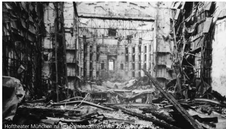
Hoftheater München na het bombardement van 2 oktober 1943

Het werk aan Metamorphosen kostte Strauss ongeveer negen maanden, van augustus 1944 tot 12 april 1945, hoewel hij hiervoor al in 1943 of misschien 1942 schetsen maakte. Die periode viel samen met de laatste ontknopning van de Tweede Wereldoorlog, die Strauss in zijn Alpenvilla in Garmisch-Partenkirchen doorbracht, zover mogelijk weg van de wereld. Dat was ongeveer honderdvijftig kilometer ten westen van Berchtesgaden, waar een van de belangrijkste hoofdkwartieren van de leider van het Derde Rijk was