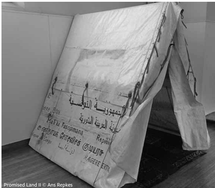
Promised Land II © Ans Repkes

In het kader van het festivalthema presenteert Ans Repkes van vrijdag 9 tot en met zondag 25 september driedimensionale installaties in Theater aan het Vrijthof. ❖