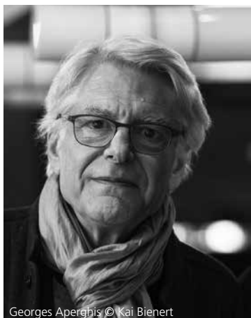
Georges Aperghis